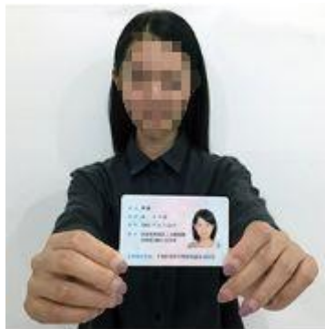
手持身份证照片示例图