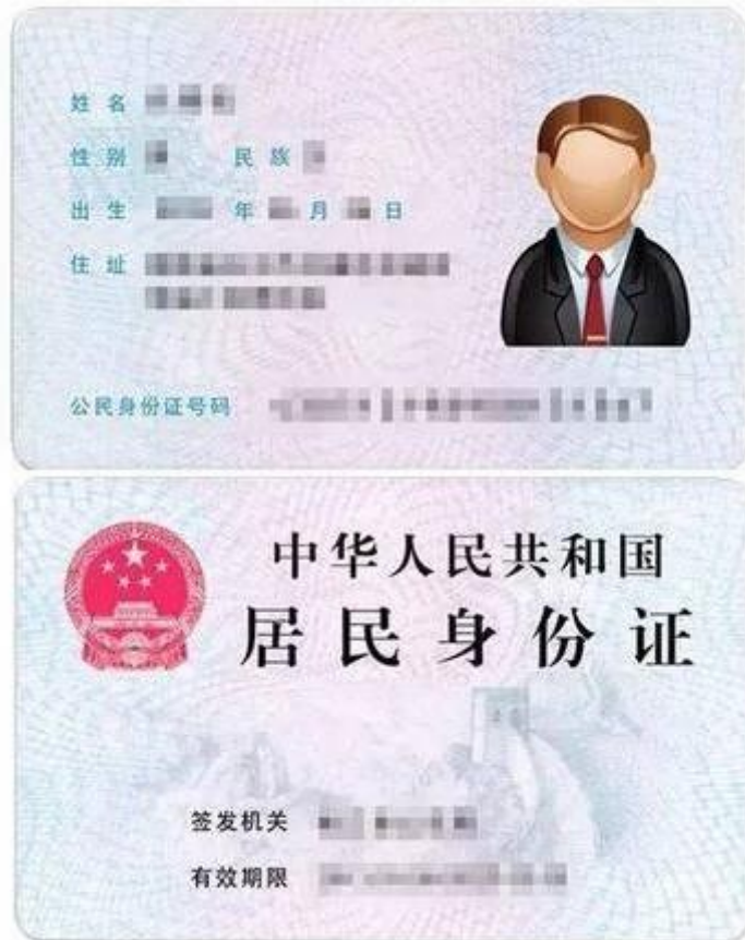
身份证照片示例图